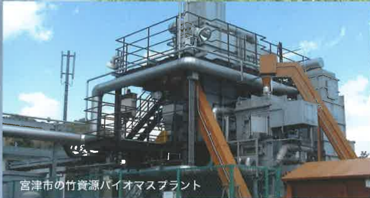
宮津市の竹資源バイオマスプラント