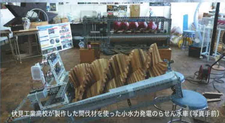
伏見工業高校が製作した間伐材を使った小水力発電のらせん水車(写真手前)

家庭用太陽光発電パネルの普及や市民協働発電所による電力供給の開始など、いよいよ市民がエネルギーを創る時代に入りました。今回の「つどい」では、昨年引き続きこのテーマから一歩踏み込んで、消費者・市民が考え行動する方向を見つけないかと思っています。