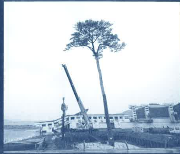
陸前高田市の津波に耐えた一本松。復興のシンボルとして期待されている。(6月10日撮影)