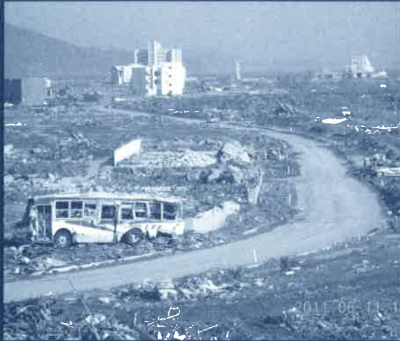
あれから3か月経った6月11日の 岩手県陸前高田市気仙町にて