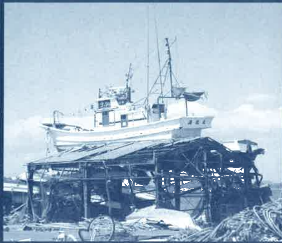
宮城県七ヶ浜町にて(5月25日撮影)