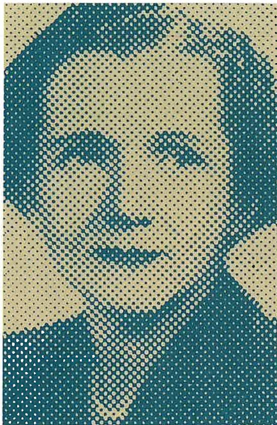
レイチェル・カーソン (1907～1964)

アメリカの海洋生物学者。化学物質による環境汚染についていち早く警告した。彼女の著書「沈黙の春」「センス・オブ・ワンダー」はいまも読みつがれている。